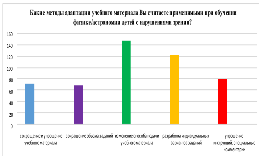
Рис. 2 – К вопросу № 12

Анализ полученных результатов показывает, что для развития у учащихся с нарушением зрения творческих способностей при обучении физике в школе необходима организация адаптивного учебного процесса и формирование методических компетенций учителя по его реализации путем подбора приемов, методов, форм организации деятельности, создания образовательной среды для самостоятельной творческой деятельности обучающихся с нарушениями зрения с тьюторской помощью.