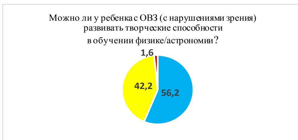
Рис. 1 – К вопросу № 11

Как показали анализ имеющихся психологических исследований и проведенное нами анкетирование учителей физики / астрономии Краснодарского и Ставропольского краев, Ростовской области, у слабовидящих детей недостаточный уровень познавательной активности, незрелость мотивации к учебной, самостоятельной деятельности, быстрое снижение работоспособности, ограничение наглядного восприятия опытов (мелкие шкалы, мелкие детали), видеоматериалов, презентаций, написанного на доске, точного восприятия (таблиц, графиков, объектов). Но при этом на вопрос «Можно ли у ребенка с ОВЗ (с нарушениями зрения) развивать творческие способности в обучении физике / астрономии?», почти все учителя дали положительный ответ (Рис. 1).