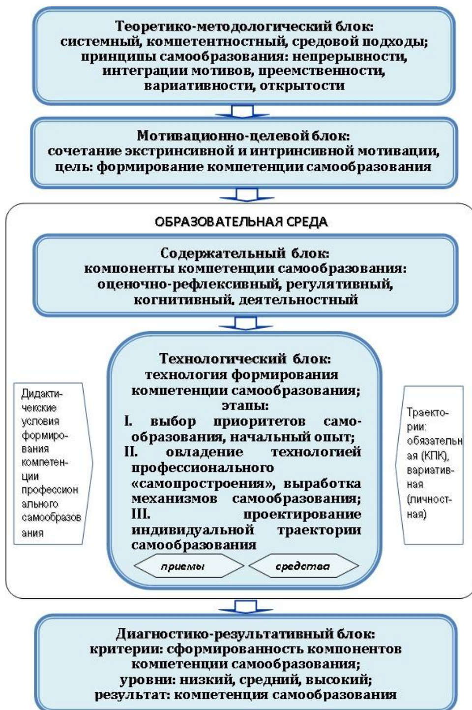
Рис. 1 – Модель системы формирования компетенции профессионального самообразования у слушателей профессиональной переподготовки и повышения квалификации