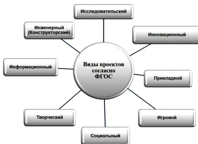
Рис. 4 – Виды проектов

Существует несколько видов проектов, которые выделены во ФГОС (Рис. 4).