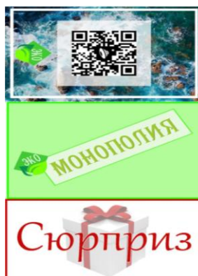
Рис. 6 – Внешний вид карточек игры «Эко-монополия»

Мы решили создать карточки с QR-кодом, за которым скрыт вопрос, видео, карта реальной ситуации страны или края (Рис. 5). При этом у детей с нарушениями зрения есть возможность увеличения формата самого вопроса и звукового его восприятия. Кроме этого, по аналогии с игрой Монополия, были разработаны дополнительные карточки «Сюрприз» (Рис. 6) и определены вопросы стоянок «Болото» и «Зыбучие пески».