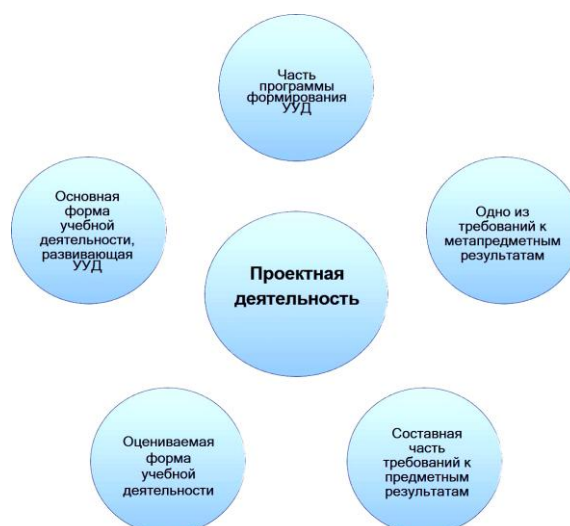
Рис. 3 – Проектная деятельность по ФГОС

Проект – задание, направленное на получение продукта, обладающего новизной (субъективной или объективной) и прикладной ценностью для определенной деятельности. То есть результатом любой проектной деятельности является практически значимый продукт.