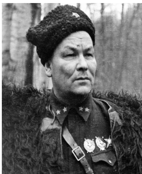
Н.Ф. Цепляев, в августе 1942 г. полковник, командир 40-й ОМСБР

Редкий экземпляр автомобиля марки Форд «Пигмей» (Ford Pygmy) поставлялся в СССР по ленд-лизу и использовался в качестве транспорта для штабных и разведывательных целей. «Пигмей» входили в автопарк 40 ОМСБр СКФ