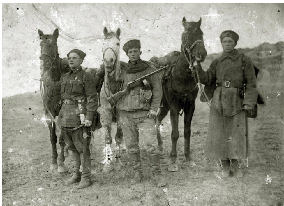
Фото казаков 72-й Кубанской казачьей кавалерийской дивизии, сделанное на Крымском фронте в 1942 г. В мае 1942 г. в ходе разгрома гитлеровцами Крымского фронта, 72 КД в районе города Керчь обеспечила переправу частей фронта на Таманский полуостров. 15 июня из-за тяжёлых потерь была расформирована и направлена на пополнение 40-й отдельной мотострелковой бригады (ОМСБр) Северо-Кавказского фронта. 3 августа 1942 г. 40-я ОМСБр участвовала в обороне Армавира

Крым, была отведена на Кубань для переформирования, а кавалеристы были зачислены в мотострелки. При этом многие казаки-кавалеристы сохранили специфические элементы своей униформы в виде папах-кубанок, бурок, черкесок, башлыков и т. д. Из-за экзотического внешнего вида новоиспеченных казаков-мотострелков 40-й ОМСБр стали образно называть «пластунской» [3], с чем конечно можно согласиться лишь с большой натяжкой.